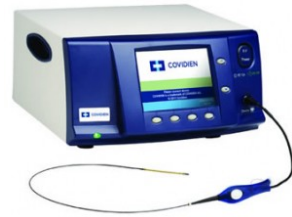
COVIDIEN ClosureFast™ カテーテル ClosureRF™ ジェネレーター