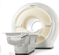
Philips Ingenia 3.0T