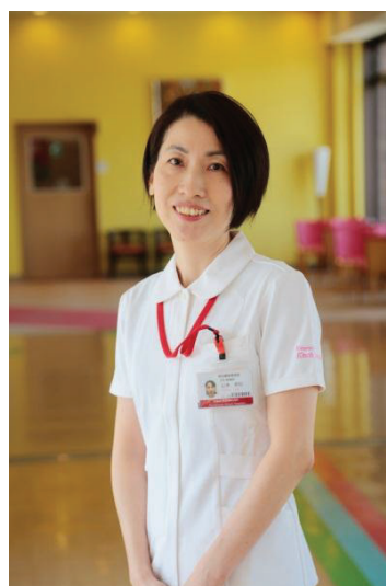
感染管理認定看護師